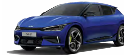
Yacht Blau Metallic (DU3)