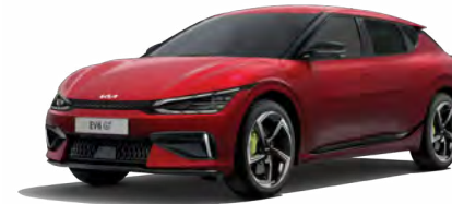
Runway Rot Metallic (CR5)

Der EV6 GT ist so individuell wie du. Passe ihn deinem Stil an. Denn jedes Detail zählt.