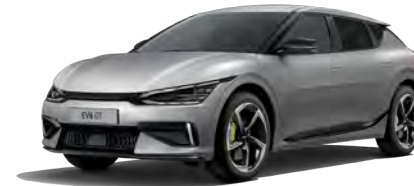
Moonscape Matt (KLM)